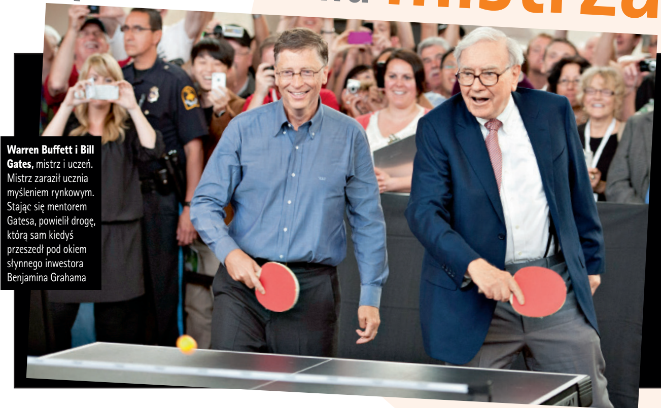
Warren Buffett i Bill Gates, mistrz i uczeń. Mistrz zaraził ucznia myśleniem rynkowym. Stając się mentorem Gatesa, powielił drogę, którą sam kiedyś przeszedł pod okiem słynnego inwestora Benjamina Grahama

Prosta i stara jak świat metoda: chcesz się czegoś nauczyć – znajdź mistrza, który będzie twoim przewodnikiem. Podzieli się wiedzą, doświadczeniem i wesprze w rozwoju biznesu czy inwestowaniu